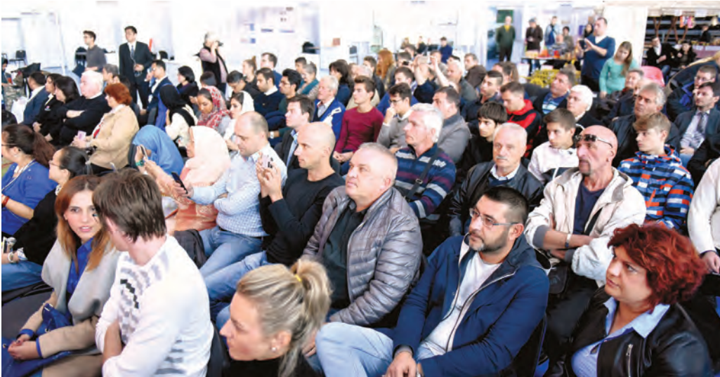
● Auditorij u iščekivanju nagrada