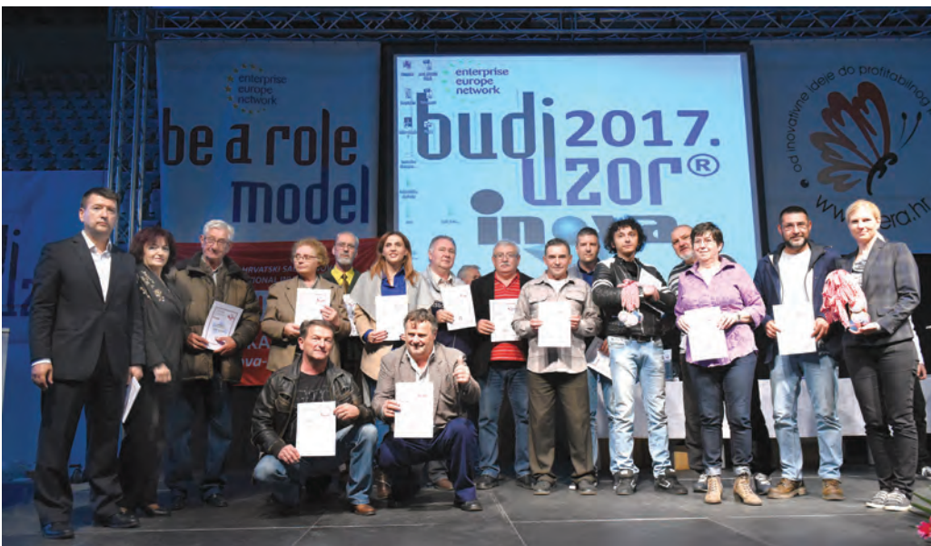
● Dobitnici nagrada iz Hrvatske udruge inovatora-poduzetnika i Tera klijenata