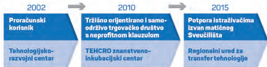
● Razvojni put TERA Tehnopolisa

Mreža suradnika i partnerskih institucija, koncentracija konzultantskih kompetencija širokog spektra i vrhunske kvalitete, čine TERA-u institucijom koja svojim klijentima pruža potpunu potporu u procesu transformacije inovativnih ideja u profitabilna poduzeća.