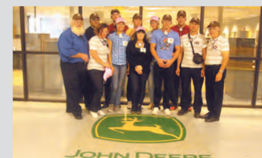
TEHNOstart u posjetu John Deer tvornici u Sjevernoj Carolini 2012. godine