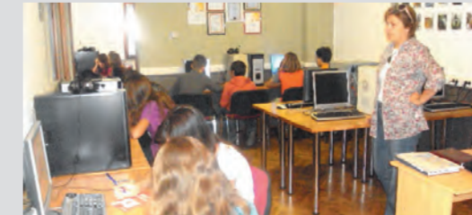
Suradnja s udrugom Sjedi 5 pokazala je da se hrvatski jezik može učiti na zabavan način