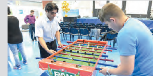
Naporni treninzi svakako su pomogli, a prva nagrada otputovala je u Iran