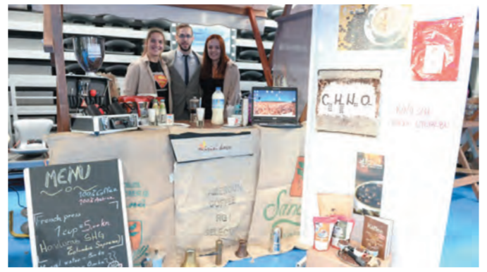
Za održavanje sudionika u budnom stanju bio je zadužen tim Mirisi kave