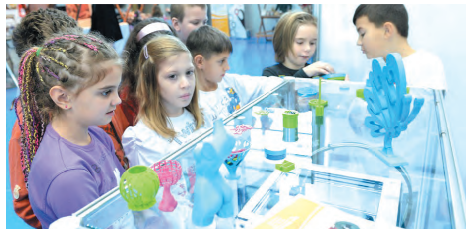
Novi Tera 3D pišač bio je posebno zanimljiv najmlađima