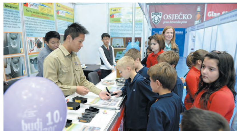
Najmlađi su puno toga mogli naučiti od stranih izlagača

Datum: 9. 12. 2014., 11 sati, Mjesto: Osijek, Tera Tehnopolis d.o.o., Trg Ljudevita Gaja 6, predavaonica 3