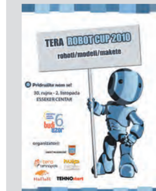
Mini sumo i line follower roboti najsloženiji su tehnološki projekt koji provodi TEHNO