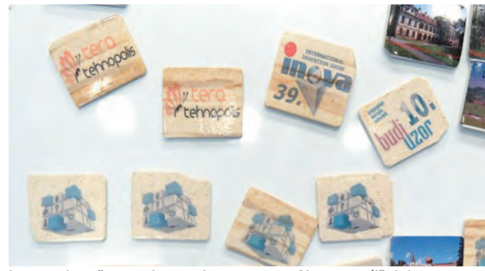
Inovatorima često prigovaraju za sporost. Na ovogodišnjoj izložbi neki su ipak demonstrirali zavidnu brzinu i učinkovitost