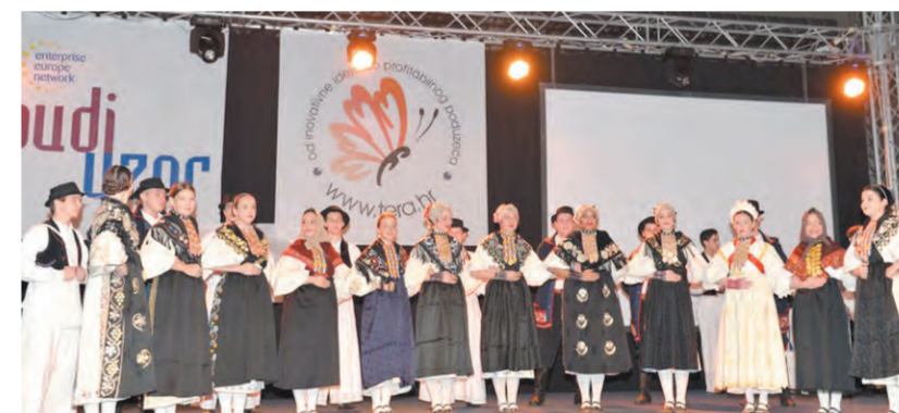
HKUD Željezničar nastupio je na svečanosti zatvaranja izložbe