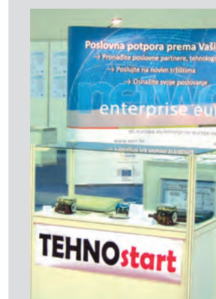
Izložba mini sumo robota i stariji računala 2013. godine u Zagrebu