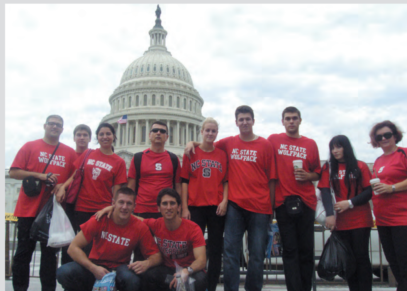
Posjet Washington DC-u