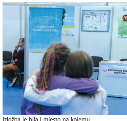
Izložba je bila i mjesto na kojemu se sklapaju nova prijateljstva