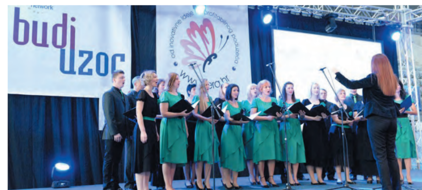
HPD Lipa bio je zadužen za izvođenje himni