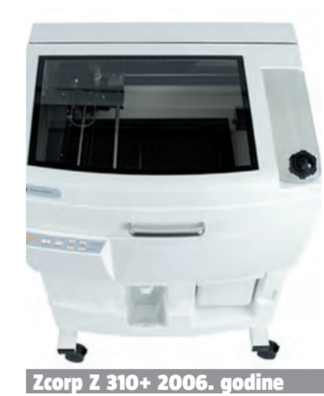
Zcorp Z 310+ 2006. godine

U Hrvatskoj djeluje puno udruga koje okupljaju inovatore i pomažu im u njihovom radu. HUIP - Hrvatska udruga inovatora poduzetnika bitno je drukčija udruga, ona okuplja domaće i strane inovatore i poduzetnike koji su spremni prihvatiti misiju Udruge: komercijalizaciju bar jedne inovacije, vlastite ili tuđe, tijekom radnog vijeka. I upravo u ispunjavanju misije članovi potvrđuju valjanost koncepta jer naglasak inovatorskog rada nije u izlaganju inovacija na izložbama i publicitetu koji se tim činom generira, već na poduzetničkoj aktivnosti koja je temeljena na inovativnim, po mogućnosti zaštićenim proizvodima i tehnologijama. Strateško partnerstvo TERA-HUIP-TEHNOstart dobro funkcionira, i proizvodi sinergijski učinak, koji se jako dobro vidi upravo u vrijeme održavanja izložbe.