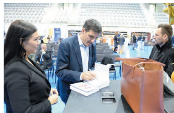
Nakon promocije knjige "Hrvatski velikani" održano je potpisivanje knjiga i razgovor s autorom