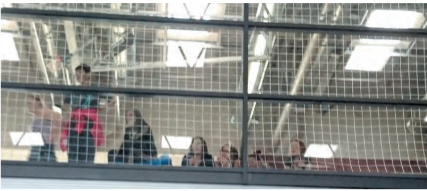
Svečanost otvorenja bila je toliko zanimljiva pa su i vrlo motivirani sportaši na čas prekinuli naporan trening